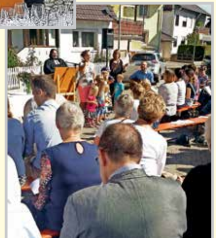
Gottesdienst am Sonntag