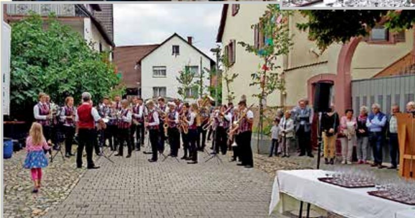
Der Musikverein eröffnet das Fest